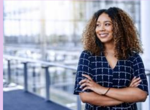
PRÁCTICAS DE EMPLEO JUSTAS