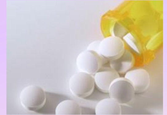
COMPETENCIA JUSTA, PRECIOS Y ANTIMONOPOLIO