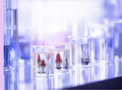
FRAUDE Y CORRUPCIÓN