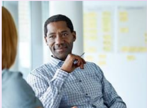
LEYES CORPORATIVAS Y SOBRE VALORES